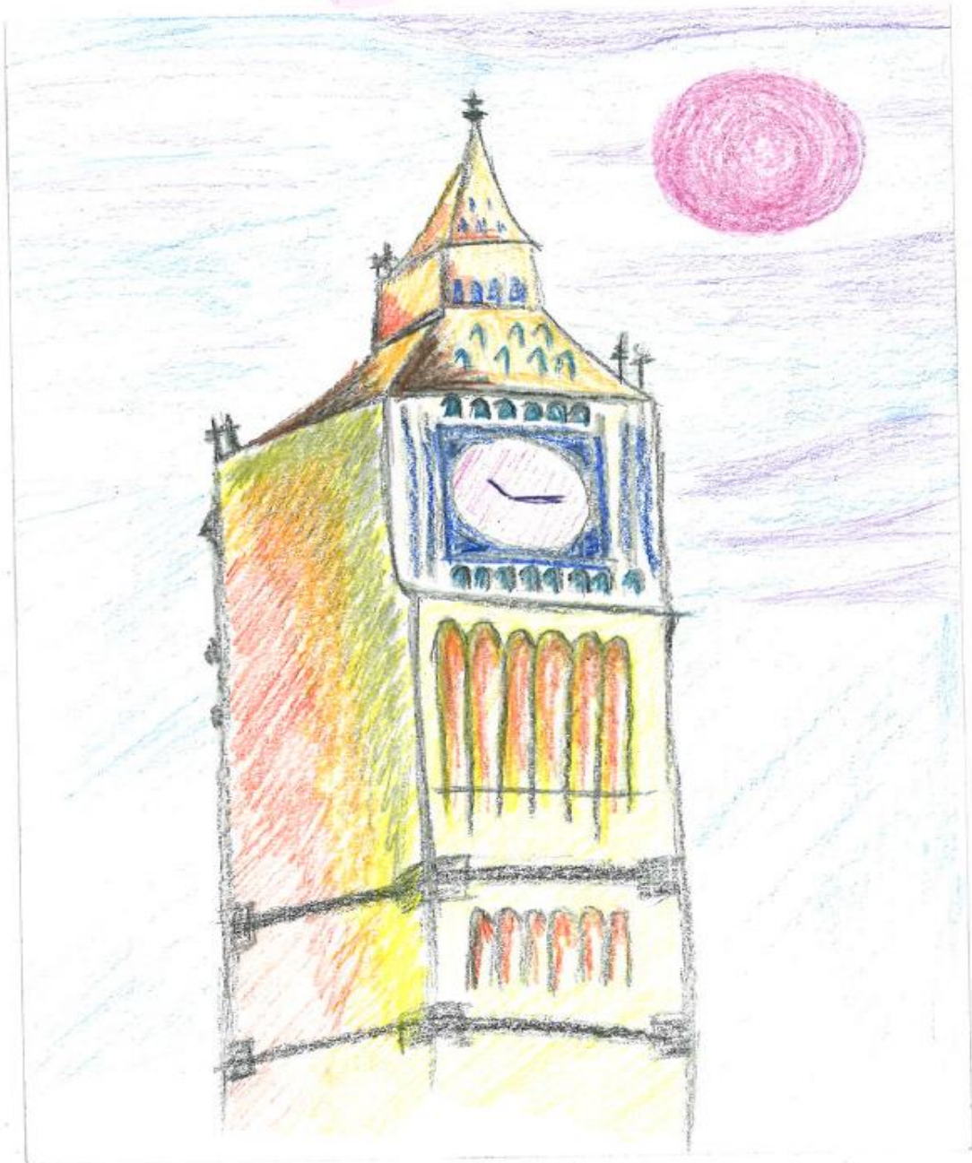
Big Ben, London